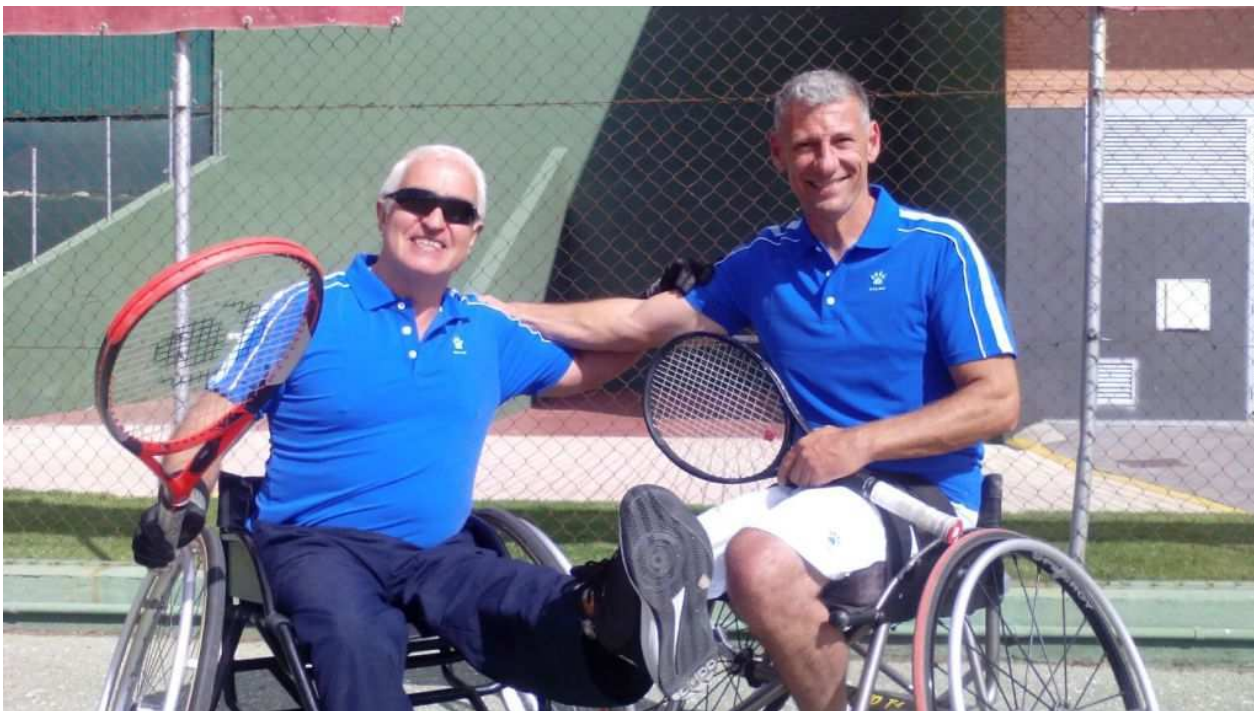
Elastorsa colabora con la Fundación Deporte Sin Barreras

Por noticiasdearnedo.es - 6 octubre, 2017