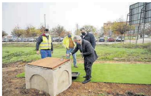
► El alcalde y el responsable de Preving, con la primera piedra.

elegido a Badajoz como referente. El grupo Preving cuenta con 1.500 trabajadores, 300 de los cuales están en Badajoz, más de 70 centros propios repartidos por España y 190 centros asociados. Según el alcalde, que hay decidido invertir 10 millones de euros en esta ciudad, demuestra que «desde Extremadura y desde Badajoz se pueden liderar mercados nacionales y ellos son un clarísimo ejemplo: un grupo que nace con un tamaño pequeño, que hace 19 años facturaba 2 millones de euros y hoy superan los 75». Para el alcalde, la primera piedra que ayer se colocó «es una metáfora de lo que va a ocurrir en próximas fechas en la ciudad de Badajoz». =